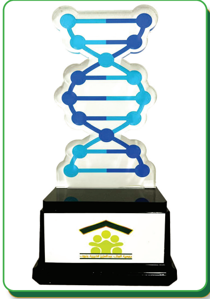
درع شريك النجاح - التجمع الصحي