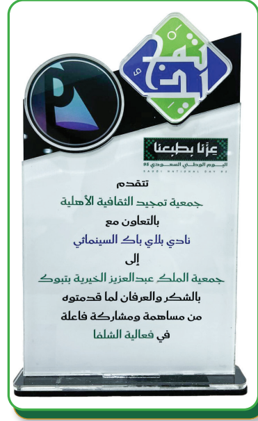
درع تكريم من جمعية تمجيد