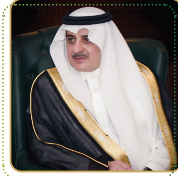
صاحب السمو الملكي الأمير فهد بن سلطان آل سعود رئيس مجلس إدارة جمعية الملك عبدالعزيز الخيرية ببتوك