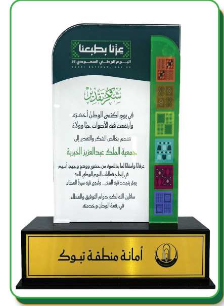
درع تكريم من أمانة تبوك