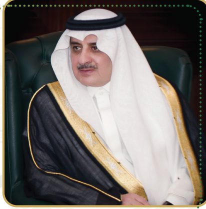
صاحب السمو الملكي الأمير فهد بن سلطان بن عبدالعزيز آل سعود رئيس مجلس إدارة جمعية الملك عبدالعزيز الخيرية بتبوك