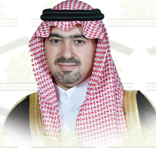
صاحب الشوخي الأمير

خالد بن سعود بن عبد الله الفيضان بن عبد العزيز